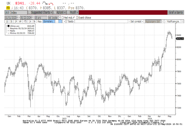
Indice Ftse100: andamento